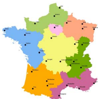
Répartition des régions échantillonnées (INCA2)

*Les AJMT sont soumis à des variations selon les évolutions normatives (LMR) et des connaissances sur la toxicité des substances (DJA). La liste présentée ici correspond aux AJMT tels que calculés au démarrage de l'étude (2006).